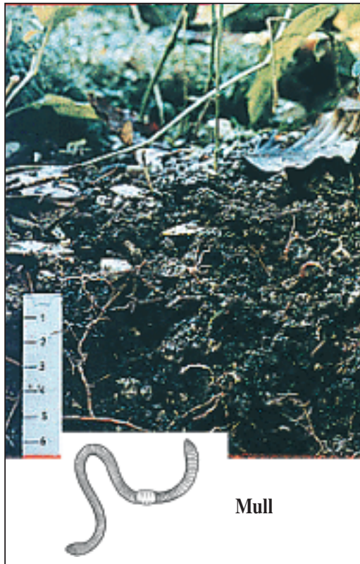
Figure 1 - Forme d'humus et activité biologique Figure 1 - Humus forms and biological activity