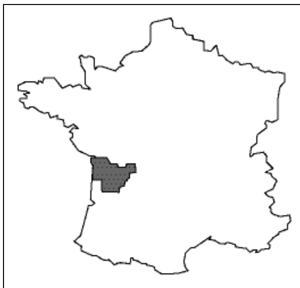
Figure 1 - Cognac vineyard location